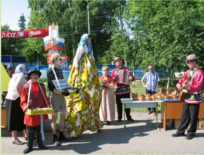
мастеров, занимающихся валяльным промыслом.

История Сухокарсунского гончарного промысла насчитывает не одно столетие. Посуда из знаменитой глины была в ходу как у жителей Карсунского района, так и далеко за его пределами.