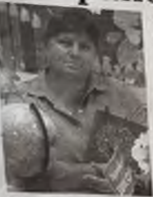
Активное участие в проведении выборов в Общественную палату Карсунского района

В ближайшее время планируем больше внимания уделять вопросам и проблемам социальной сферы в районе, совершенствованию системы ЖКХ, благоустройству населенных пунктов. Особого внимания требует налаживание взаимодействия с молодежными организациями, волонтерским добровольческим движением, развитие новых видов спорта в районе. Для этого у нас есть все условия. В 2023 году члены палаты в качестве общественных наблюдателей планируют принять