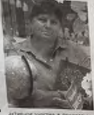
Активное участие в проведении выборов в Общественную палату Карсунского района

В ближайшее время планируем больше внимания уделять вопросам и проблемам социальной сферы в районе, совершенствованию системы ЖКХ, благоустройству населенных пунктов. Особого внимания требует налаживание взаимодействия с молодежными организациями, волонтерским добровольческим движением, развитие новых видов спорта в районе. Для этого у нас есть все условия. В 2023 году члены палаты в качестве общественных наблюдателей планируют принять