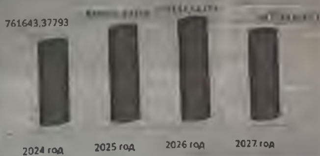
Расходы бюджета муниципалитетного образования «Карсунский район» Ульяновской области в 2024-2027 годах, тыс. рублей